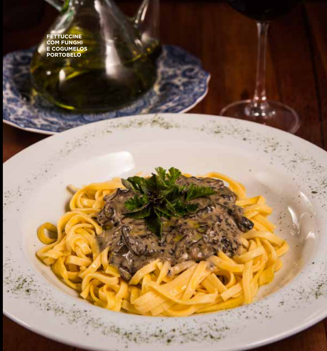
FETTUCCHINE COM FUNGHI E COGUMELOS PORTOBELLO

ADICIONE UM MOLHO POR MAIS R$4,00 Molho Ravello, molho crocante, molho de maracujá ou molho mostarda