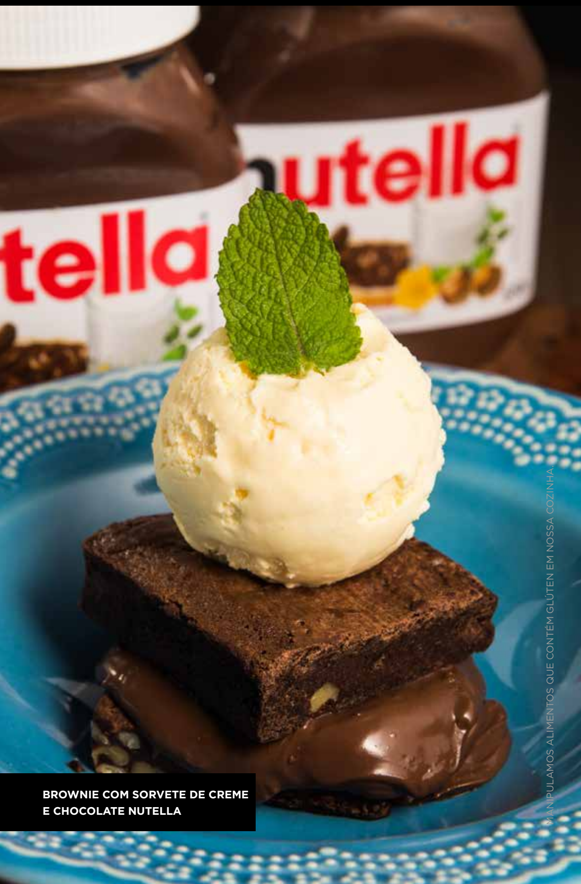
BROWNIE COM SORVETE DE CREME E CHOCOLATE NUTELLA

PETIT GATEAU COM SORVETE E DOCE DE LEITE R$19,90